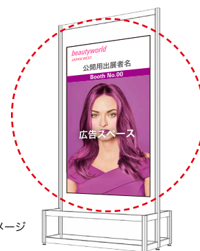
広告ボードイメージ