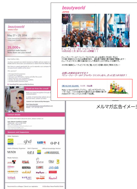
メルマガ広告イメージ

申込み締切日 2021年8月20日 (金) データ入稿締切日 2021年9月 3日 (金)