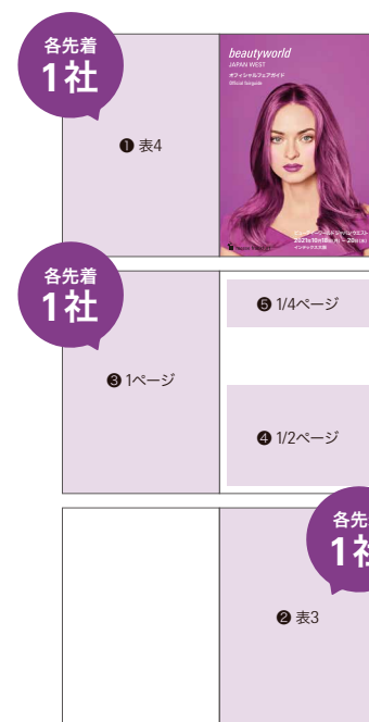
広告フォーマットイメージ