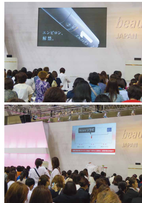
ステージイメージ