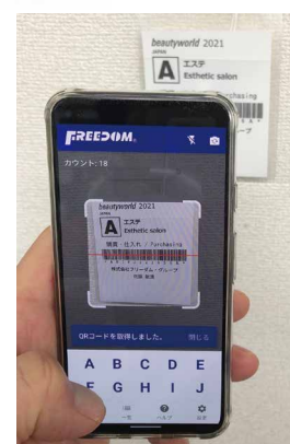
スマートフォンイメージ